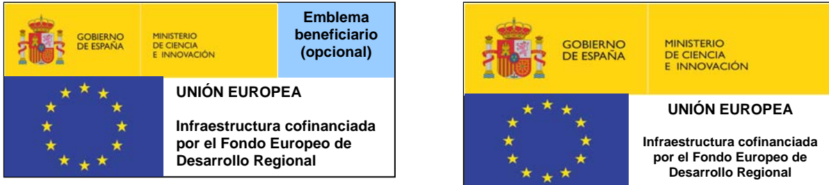
Figura 3: Ejemplos de adhesivo para colocar en los equipos cofinanciados

La siguiente figura muestra dos ejemplos de adhesivo: