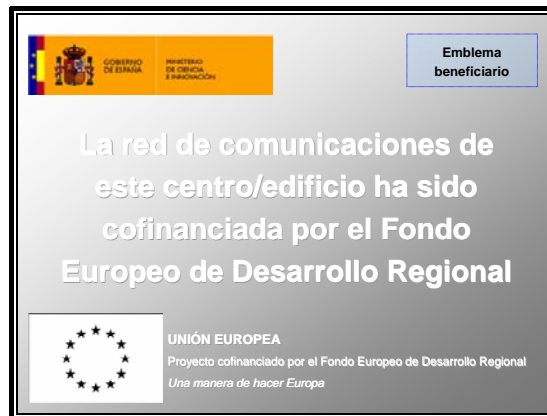
Figura 4: Ejemplo de placa explicativa en red de comunicación

La siguiente figura muestra un ejemplo de placa explicativa: