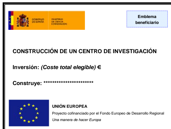
Figura 1: Ejemplo de cartel en obra de construcción

La siguiente figura muestra un ejemplo de cartel: