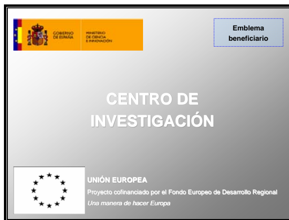
Figura 2: Ejemplo de placa explicativa en centros construidos

La siguiente figura muestra un ejemplo de placa explicativa: